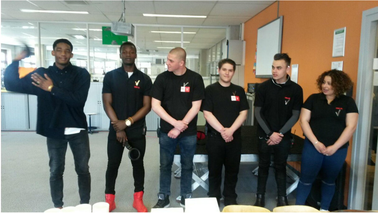
Team beveiliging ( plattegrond maken, indeling rooster en beveiliging objecten)