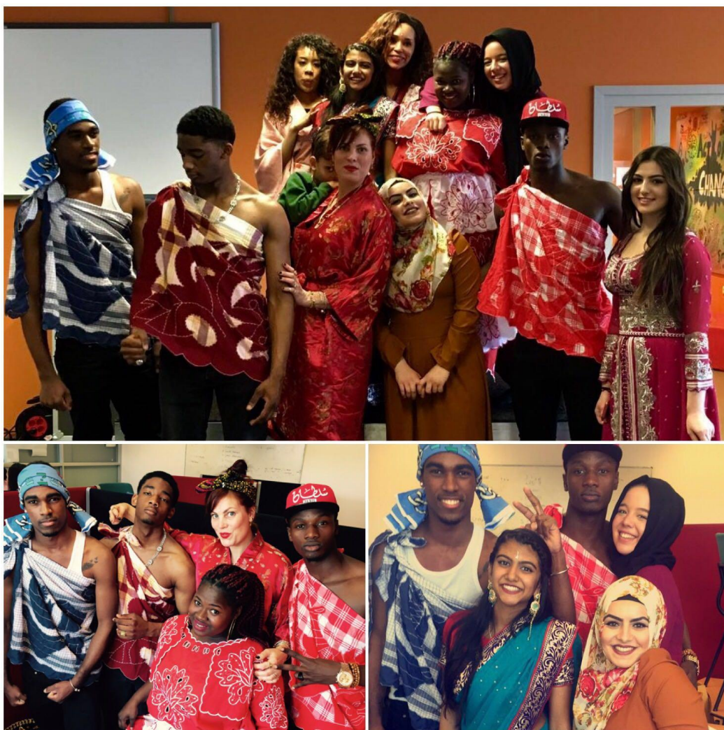
Modeshow Verschillende culturen