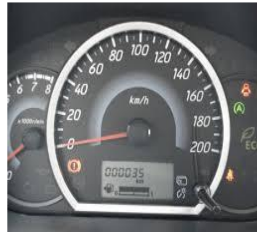
De maximale snelheid =..... -29 =.....(D)